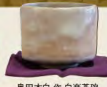
奥田木白 作 白楽茶碗